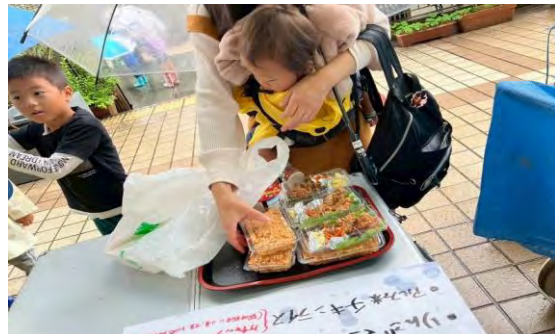
お天気が悪くても こどもたちと頑張ってお弁当を出かけてきてくれます