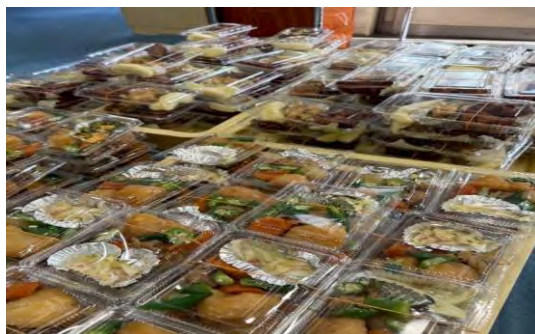
季節の野菜を、煮て焼いて揚げて。 色々な食感を味わえます！

今年度もたくさんのこどもたちや保護者の方々とお弁当配布のやり取りができ、こどもたちの日常を伺えることができました。子育て支援センターで開催しているこども食堂、あいくる・みんなの広場巣立っていった親子さんに会えるのもありがたい時間です。当日のお弁当の材料や季節の野菜の話、給食や幼稚園の行事の話、今流行ってるもの、家族で楽しんできたことなど、日頃の様子をたくさん話してくれるこどもたちの笑顔がそこにいる大人を笑顔にします。そんな様子を地域の方々も見守っていただき、少し立ち寄ってくれたり... 月一回の開催ですが、多年齢のちょっとしたコミュニティになっております。地域の方々からのご提供品があり、美味しく調理してくれるボランティアさんのご厚意があり、会場セッティングに近隣施設の協力があり、毎月このようなこどもたちとのふれあい時間が無事に開催できました。ありがとうございました。